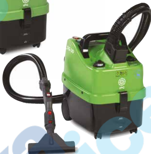
SG-30 - КОТЕЛ З АВТОЗАПОВНЕННЯМ БАК